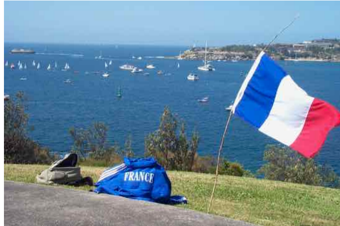
Le rond « D » de la baie de Sydney