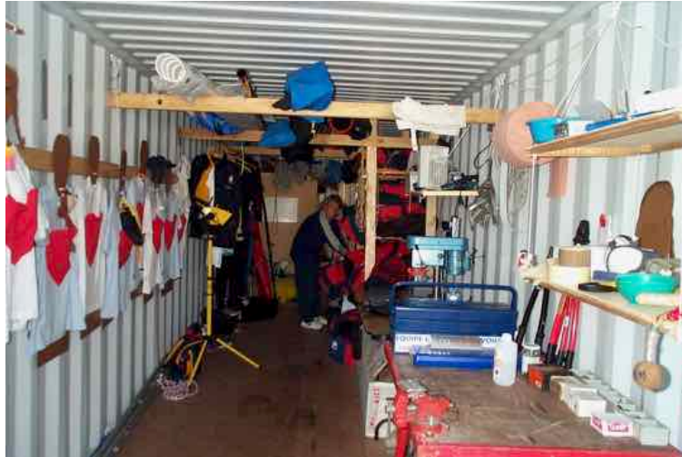
Le container de l'Equipe de France sur la marina olympique

Préparation mentale : chaque coureur de l'équipe de France a une silhouette aborant un cœur qui est une poche, dans laquelle on peut glisser un petit mot, d'encouragement, de réconfort, de félicitation... En effet toute l'équipe de France donc toutes les séries aux JO ont le container comme camp de base. Avec les spécialistes et entraîneurs une vingtaine de personnes vont se croiser avec des horaires différents, des programmes différents, pas facile de gérer les relations entre tous. Pour éviter autant que possible les désagréments des questions invariables du type « ça a marché aujourd'hui ? » il est donc possible de glisser un petit mot dans le cœur pour montrer aux autres son attention sans perturber.