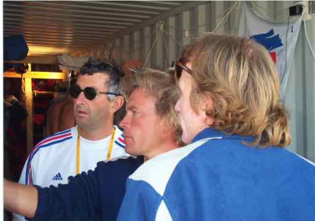
Philgom au premier plan Monsieur Règlement