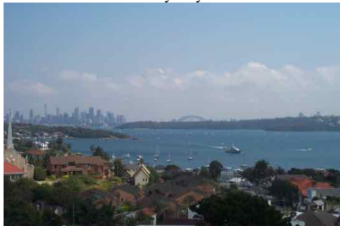
La fantastique baie de Sydney

Les 2 ronds de régates extérieurs à la baie de Sydney : au bord des falaises