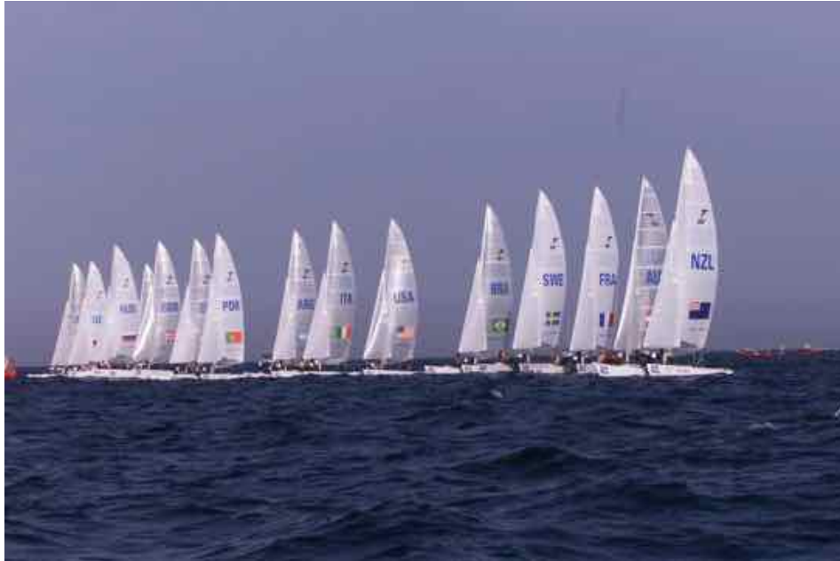
Les Tornados au départ