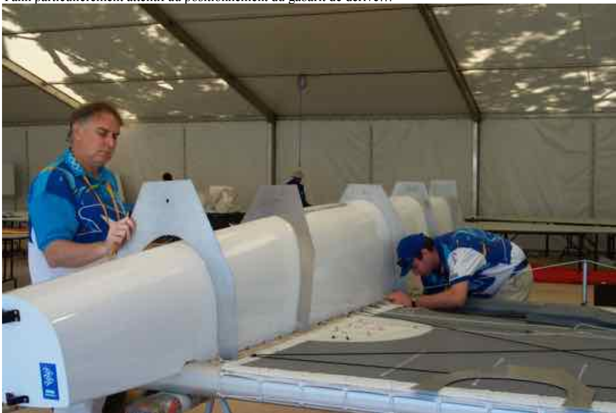
Les couples, une opération délicate...

La vérification porte aussi sur l'exploration des parties cachées : ainsi les embouts de poutre sont démontés pour voir si rien ne se cache à l'intérieur.