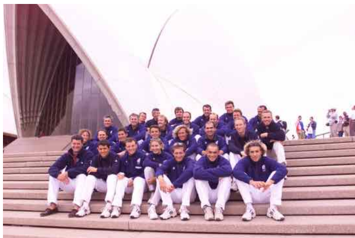
L'Equipe de France de Voile SYDNEY 2000

Il nous a paru important de reprendre les « Tornado news » écrits tout au long de cette PO et des Jeux pour témoigner d'une période très intense et qui a laissé de très bons souvenirs.