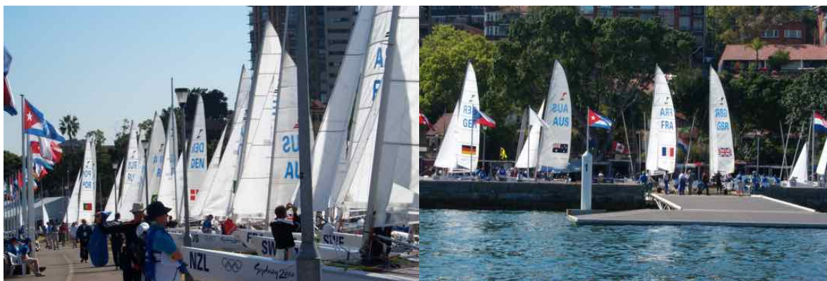
La Marina Olympique Sydney 2000

La séance sur l'eau a été rendue très difficile :